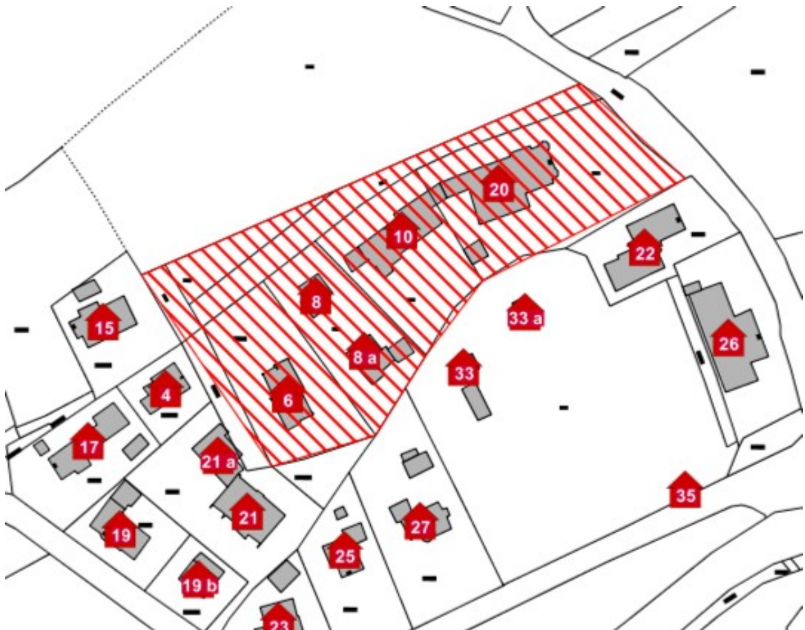
Karte 3: Bereich Sonnenfeld

Nach dem Auf- bzw. Ausbau sollen in diesem Bereich Übertragungsraten in mindestens doppeltem Umfang 2 der Übertragungsraten (Upload und Download) gemäß der Darstellung des Ergebnisses der Markterkundung für alle möglichen Endkunden, die noch nicht mit Bandbreiten nach Nr. 1.2 Satz 3 BbR versorgt werden und Übertragungsraten von mindestens 50 Mbit/s im Download für einen Teil und nicht weniger als 30 Mbit/s im Download für alle möglichen Endkunden sowie Upload-Geschwindigkeiten, die viel höher sind als bei Netzen der Breitbandgrundversorgung (mindestens 2 Mbit/s) zu Verfügung stehen.