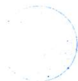
Peter Höß 1. Bürgermeister