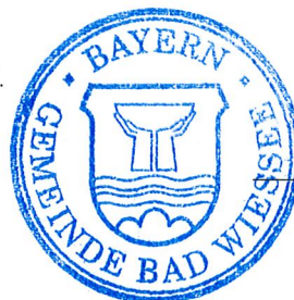
Robert Kühn Erster Bürgermeister