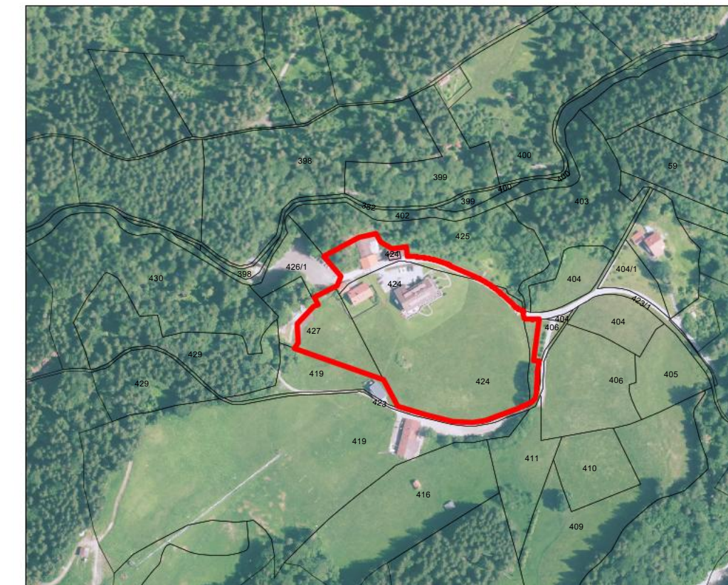
Übersichtslageplan M 1: 5.000